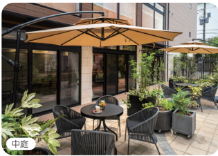
中庭 西館と東館の間にある中庭でゆったり寛ぐことができます。人と人の触れ合いの中で、活き活きとした時間が流れます。

介護付有料老人ホームとして千葉県内でも最高クラスの広さのお部屋や、最新のICTを備えた東館と、上質な住空間とおもてなしの実績を重ねてきた西館。コンシェル舞浜のゆとり・やすらぎ・おもてなしの第二章が始まります。