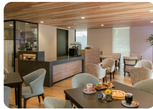
大きな窓から光が差し込むカフェスペース。カフェ仕様の本格的なお茶を飲みながら優雅なひと時を過ごせます。