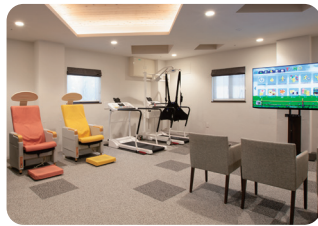
健康のためにフィットネススペースをご用意。最先端のマシンと機能訓練指導員がしっかりサポートいたします。