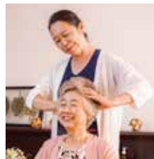
インド式ヘッドケア

温かい手で触れさせていただき、1対1の空間でお話をするのが癒し(心のケア)につながると、心を込めて提供しております。