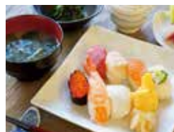
イベント食の一例