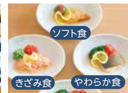
食事ケア(形態食) ソフト食 きざみ食 やわらか食