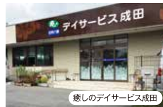
癒しのデイサービス成田