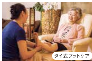
タイ式フットケア