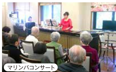
マリンバコンサート

多種多様なレクリエーションや音楽イベント。趣味や特技を生かしたクラブ活動等々、豊富なアクティビティが揃っています。