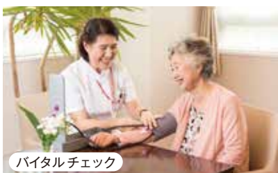
バイタルチェック

ベテラン看護師が、日々の健康チェックを行っています。24時間連携で緊急時のサポート体制も万全です。