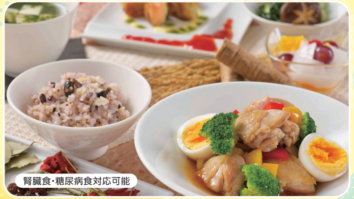
腎臓食・糖尿病食対応可能