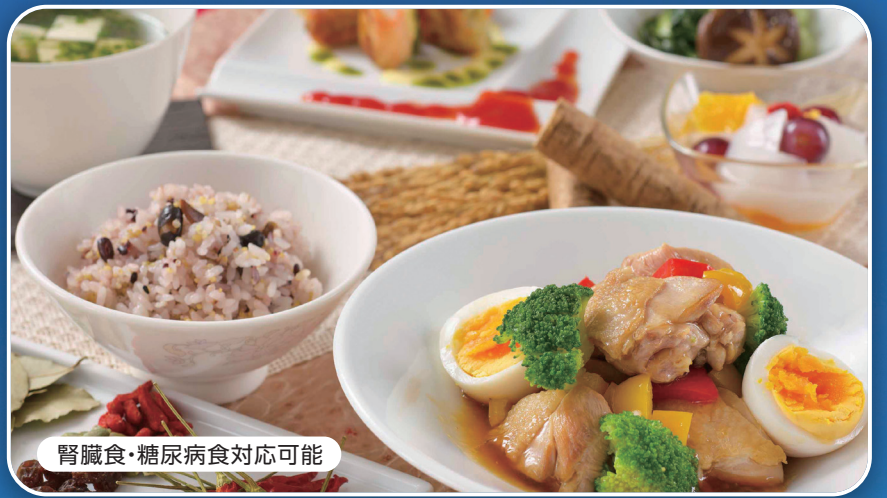
腎臓食・糖尿病食対応可能

対象 75歳以上で介護保険をお持ちの方・そのご家族の方 75歳以下の方は個別にご相談承ります。