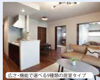
広さ・機能で選べる9種類の居室タイプ