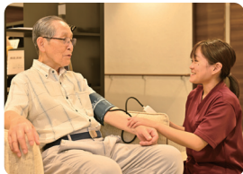
看護師が常動しているので安心です