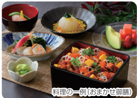
施設で作る手作り料理