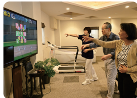
モーションセンサーでトレーニング