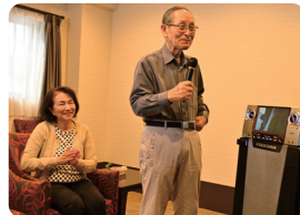
カラオケも楽しめます