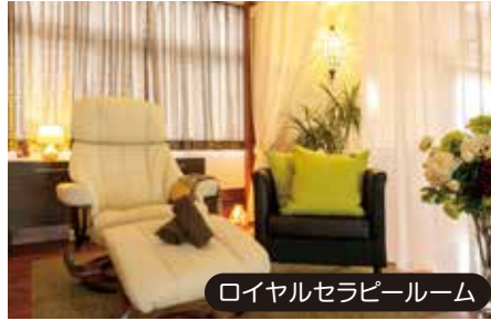
ロイヤルセラピールーム