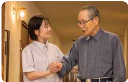
家族のように寄り添う介護