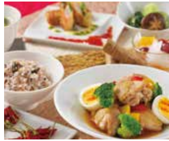
食養生を考慮した薬膳御膳