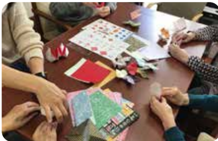
多種多様なレクリエーション