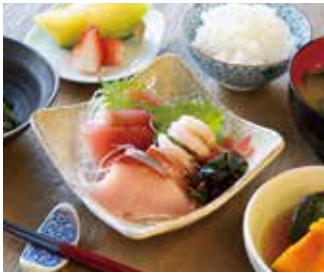
主菜を選べる選択制の食事