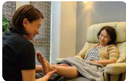
独自のリラクゼーションサービス