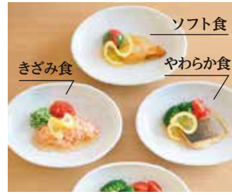
管理栄養士による『食事ケア』