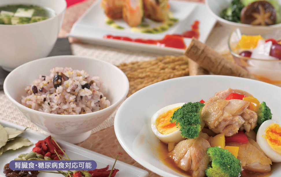
腎臓食・糖尿病食対応可能

対象 75歳以上で介護保険をお持ちの方・そのご家族の方 75歳以下の方は個別にご相談承ります。