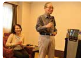
カラオケも楽しめます