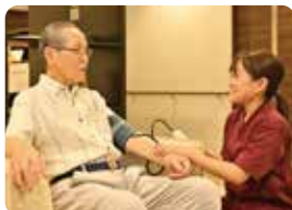
看護師が常動しているので安心です