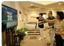
モーションセンサーでトレーニング