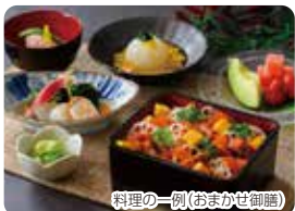
料理の一例(おまかせ御膳)