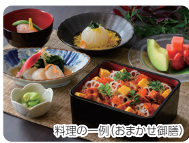
料理の一例(おまかせ御膳)