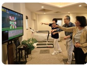
モーションセンサーでトレーニング