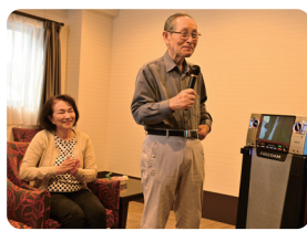
カラオケも楽しめます