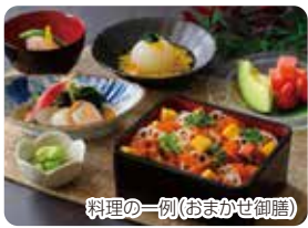
料理の一例(おまかせ御膳) 施設で作る手作り料理