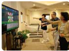
モーションセンサーでトレーニング