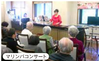
マリンバコンサート

多種多様なレクリエーションや音楽イベント、趣味や特技を生かしたクラブ活動等々、豊富なアクティビティが揃っています。