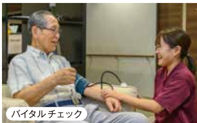
バイタルチェック

ベテラン看護師が、日々の健康チェックを行っています。24時間連携で緊急時のサポート体制も万全です。