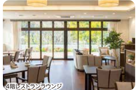
4階レストランラウンジ

送迎 見学会の送迎をご希望の方は 10時30分迄に 要予約 集合場所にお集まりください。