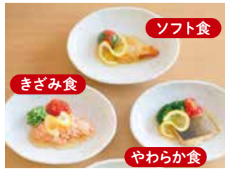
管理栄養士による『食事ケア』