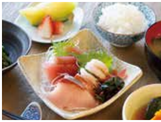
主菜を選べる選択制の食事