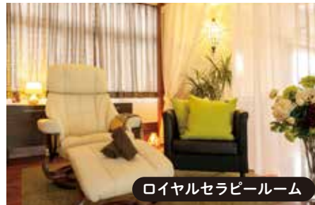
ロイヤルセラピールーム