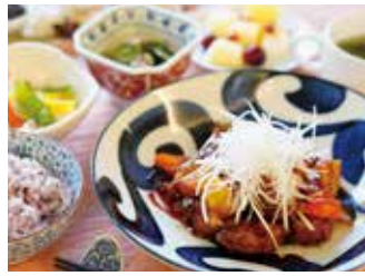
食養生を考慮した菜膳御膳