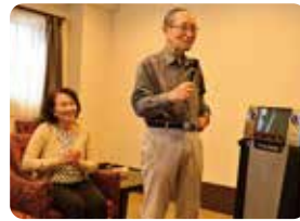
カラオケも楽しめます