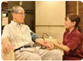
看護師が常勤しているので安心です