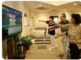
モーションセンサーでトレーニング