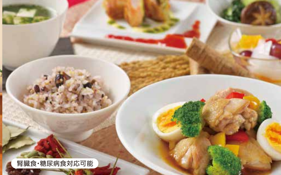
腎臓食・糖尿病食対応可能

対象 75歳以上で介護認定を受けられている方へ [75歳以下の方は個別にご相談承ります。]