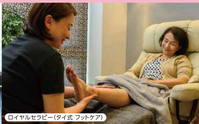
ロイヤルセラピー(タイ式 フットケア)